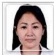
ตัวอย่าง

รูปยื่นวีซ่าอินเดีย ขนาด 2x2 นิ้ว เท่านั้น!!