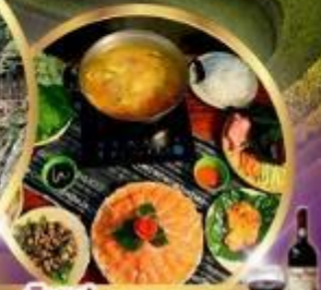
พิเศษ! ซาบูปลาผสม หม้อไฟปลาสดอร่อย + ไวน์ดालิ