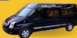
VAN (7-8 ท่าน)

สำหรับท่านที่ต้องการความเป็นส่วนตัวมากขึ้น ท่านสามารถเลือกใช้บริการ รถส่วนตัวได้ โดยมีรูปแบบรถให้เลือกถึง 2 ประเภท โดยรถ แต่ละประเภท สามารถนั่งได้ถึง 2 ท่านขึ้นไป