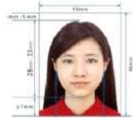
Paper Photo for Visa Application Form