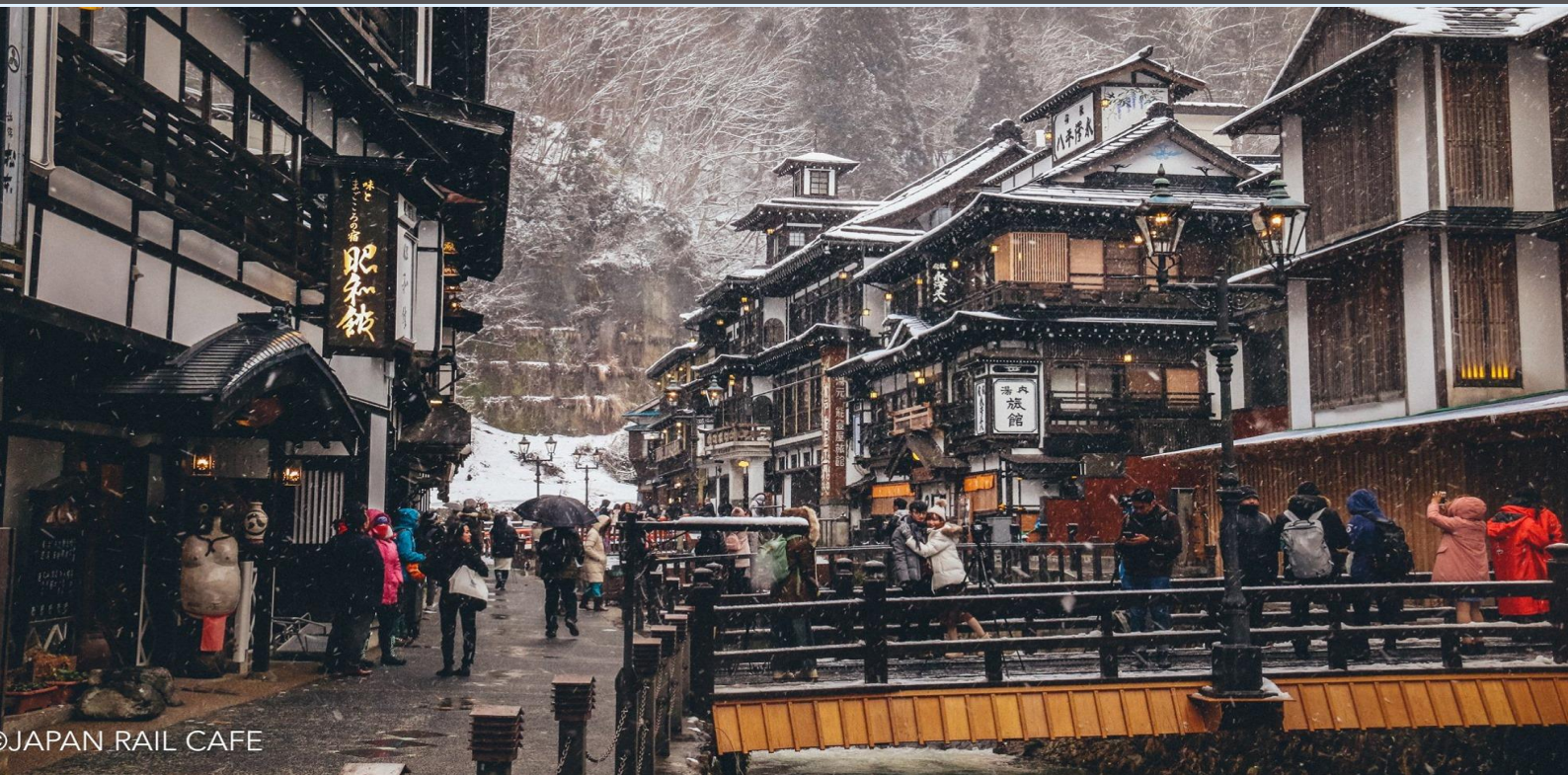
JAPAN RAIL CAFE

จากนั้นนำท่านเดินทางสู่ กินซังออนเซน ซึ่งเป็นเมืองน้ำพุร้อนที่เจียบสงบในภูเขาของจังหวัดยามากาตะ ซึ่งเดิมเป็นพื้นที่รอบเหมืองแร่เงินที่ได้ปรับปรุงและพัฒนาใหม่ มีชื่อเสียงเป็นอันดับต้นๆของประเทศญี่ปุ่นว่าเป็นเมืองออนเซนที่สวยงามที่สุดด้วยห้องพักแบบเรียวกังที่เรียงรายตามสองข้างทางของแม่น้ำ ไฉกลางเมืองกินซังออนเซน ถูกจัดให้เป็นเขตเดินเท้าเท่านั้น เนื่องจากถนนแคบ และไม่มีที่สำหรับจอดรถ จึงทำให้เมืองแห่งนี้เจียบสงบมากขึ้น โดยเฉพาะช่วงเย็น เรียวกังต่างเปิดไฟสีส้มสว่างด้วยตะเกียงก๊าซ และในฤดูหนาวทัศนียภาพก็จะดูสวยงามขึ้นด้วยหิมะตามทางเดินและหลังคา ด้านหลังของเมืองยังมีน้ำตกสูง 22 เมตร ที่ฐานของน้ำตกเคยเป็นหนึ่งในทางเข้าเหมืองเงินที่ถูกสร้างขึ้นมานานกว่า 500 ปีแล้ว ทำหน้าที่เป็นทางเข้าหลักในสมัยต้นเอโดะ นักท่องเที่ยวสามารถเดินเข้าชมอุโมงค์ภายในได้ไกลประมาณ 20 เมตรเท่านั้น จากนั้นนำท่านเดินทางสู่ย่านช้อปปิ้งขนาดใหญ่ที่ไม่แพ้ ย่านดัง ๆ ของเมืองอื่น เรียกได้ว่าชินไซบาชิแห่งโอซาก้า หรือจะเป็นชินจูกุแห่งโตเกียว มีอะไรที่นี่ก็มีเช่นเดียวกัน ย่านช้อปปิ้งที่นี่ก็คือ ถนนคิตัสโรด อยู่ใจกลางเมืองเซนได เป็นถนนสายช้อปปิ้งที่ใหญ่ที่สุดของเมืองเซนได ห่างจากสถานีรถไฟ JR Sendai เพียงไม่กี่ร้อยเมตร มีร้านค้าต่าง ๆ มากมาย ไม่ว่าจะเป็น Daiso, Aeon, ABC Mart, Donqi, Matsumoto , H&M , ABC MART , ZARA , UNIQLO ร้านสินค้าแบรนด์เนมมือสอง ฯลฯ เป็นต้น