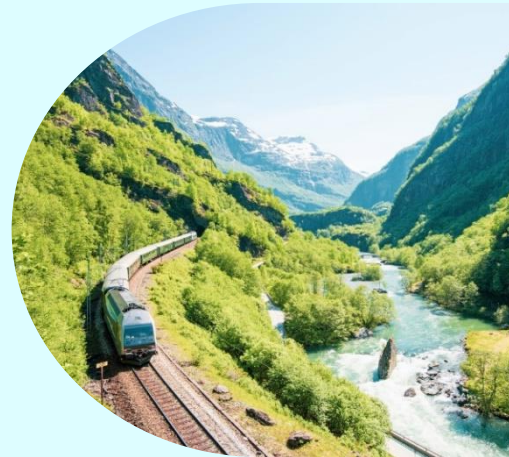
กาวิทเน็ต

นำท่าน นั่งรถไฟสายโรแมนติก “ฟลัมสบาน่า” จาก เมืองฟลัม สู่ เมืองไมร์ดัล (Flamsbana Railway from Flam to Myrdal) เส้นทางรถไฟที่โด่งดังที่สุดของประเทศนอร์เวย์ นักท่องเที่ยวจะได้ลัดเลาะไปตาม หุบเขาที่สวยงามของประเทศนอร์เวย์ โดยรถไฟจะวิ่งผ่าน อุโมงค์จำนวน 20 แห่ง โดยมีอุโมงค์ 18 แห่ง ได้ใช้แรงงานคนขุด ซึ่งระหว่างทางท่านจะได้ชื่นชมกับทัศนียภาพอันงดงามที่ธรรมชาติสรรสร้างแสนน่าประทับใจของหุบเขาอันสูงชัน และธารน้ำแข็งกลาเซียร์ แห่งพยอร์ด ไปจนถึงเมืองไมร์ดัล (Myrdal) ในระหว่างทางที่นั่งรถไฟ นักท่องเที่ยวจะได้หยุดชมความสวยงามของ น้ำตกจอสฟอสเซ่น (Kjosfossen) อีกหนึ่งจุดท่องเที่ยวที่มีความสวยงามและได้รับความนิยมจากนักท่องเที่ยวเป็นอย่างมาก น้ำตกมีความสูงประมาณ 225 เมตร ส่วนน้ำในน้ำตกนั้นไหลมาจากทะเลสาบบนเทือกเขาชื่อทะเลสาบเรนน์ (Reinungavatnet) และทะเลสาบเซลเทฟวัทเน็ต (Seltuftvatnet) หลังจากนั้นขึ้นรถไฟชมวิวต่อไปตลอดเส้นทางจนกระทั่งถึงเมืองไมร์ดัลซึ่งเป็นสถานีสุดท้ายของการนั่งรถไฟสายโรแมนติกนั่นเอง **รอบของการท่องเที่ยวอาจเปลี่ยนแปลงได้ตามความเหมาะสม กรณีไม่สามารถขึ้นรถไฟได้ ไม่ว่าจะกรณีใดก็ตาม ทางบริษัทขอสงวนสิทธิ์ไม่สามารถคืนค่าใช้จ่ายไม่ว่าส่วนใดส่วนหนึ่งให้กับท่านได้ทุกกรณี เนื่องจากการชำระล่วงหน้ากับผู้แทนเรียบร้อยแล้วทั้งหมด **