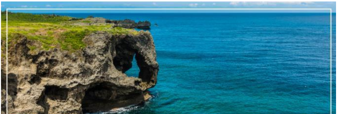
CAPE MANZAMO พามันซาโมะ

เที่ยง รับประทานอาหารกลางวัน ณ ภัตตาคาร (2)