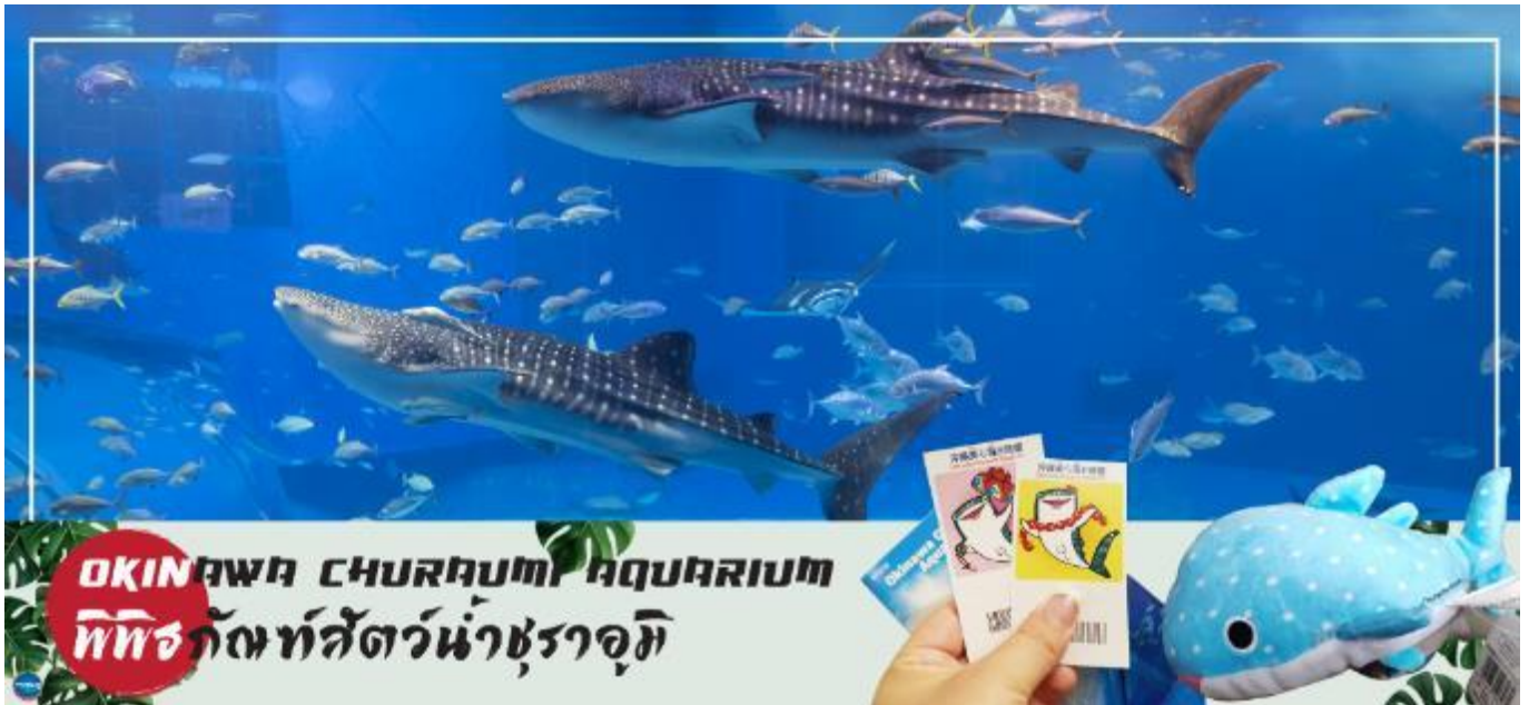
OKINAWA CHURAUMI AQUARIUM พิพิธภัณฑสัตว์น้ำชราอุมิ

เช้า รับประทานอาหารเช้า ณ ห้องอาหารของโรงแรม (1) นำท่านชม พิพิธภัณฑสัตว์น้ำชราอุมิ (OKINAWA CHURAUMI AQUARIUM) (ใช้เวลาเดินทางประมาณ 1.40 ชั่วโมง) เป็นพิพิธภัณฑสัตว์น้ำที่ดีที่สุดในประเทศญี่ปุ่น ไฮไลท์!!! ของการเยี่ยมชมพิพิธภัณฑสัตว์น้ำแห่งนี้คือแทงก์น้ำคุโรชิโอะ ซึ่งเป็นหนึ่งใน แทงก์น้ำที่ใหญ่ที่สุดของโลก ซึ่งภายในนั้นเต็มไปด้วยสิ่งมีชีวิตในทะเลแถบโอกินาวาที่หลากหลาย สัตว์น้ำที่โดดเด่นที่สุดคือฉลามวาฬยักษ์ และกระเบนราหู อีสระให้ท่านได้เพลิดเพลินกับสัตว์น้ำหลากหลายชนิด ทั้ง ปลาตาว ฉลาม ฉลามเสือ และฉลามวัว ปลาเรืองแสง ตลอดจนหอยต่างๆ นอกจากนี้ยังมีสระน้ำกลางแจ้งที่ตั้งอยู่ใกล้ริมน้ำซึ่งเป็นที่จัดการแสดงของโลมาแสนรู้ เต่าทะเล และพะยูน ที่จัดขึ้นเพียงไม่กี่ครั้งต่อวัน (ไม่มีค่าใช้จ่ายเพิ่มเติม แต่ต้องตรวจสอบเวลาการแสดงก่อนชมนะคะ)