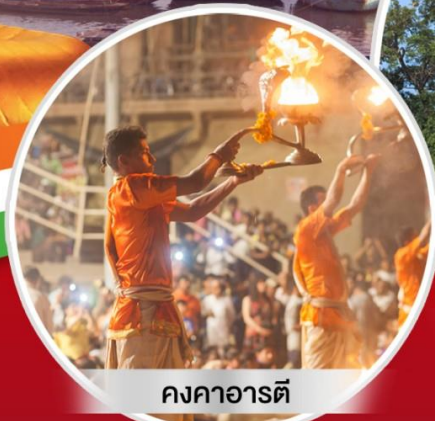
กงคาอารตี