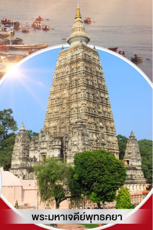
พระมหาเจดีย์พุทธคยา