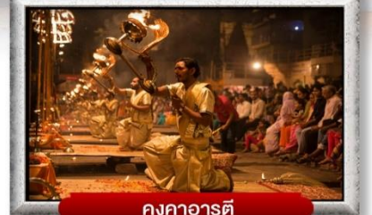
คงคาอารตี