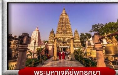
พระมหาเจดีย์พุทธคยา