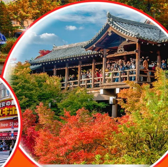
วัดโทฟุคุจิ