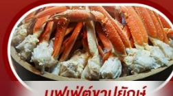
บุฟเฟ่ต์จางาปูยักษ์