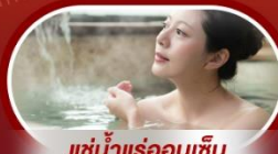
แช่น้ำแร่ร้อนเซ็น