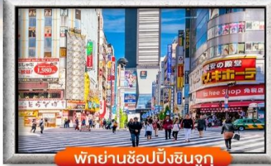
พิกย่านช้อปปิ้งชินจูกุ