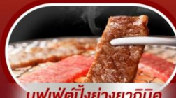
บุฟเฟ่ต์ปิ้งย่างยากินิคุ