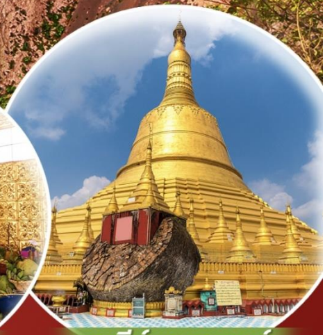
เจดีย์ชเวดากอง

สักการะ 3 มหาบูชาสถาน พม่า ย่างกุ้ง หงสาวดี ชเวดากอง เทพทันใจ พระธาตุนั้นแวง