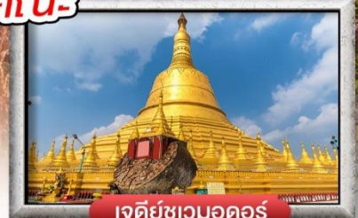
เจดีย์ชเวดากอง

เมนู สุดพิเศษ | กุ้งแม่น้ำเผา + บุฟเฟ่ต์นานาชาติ