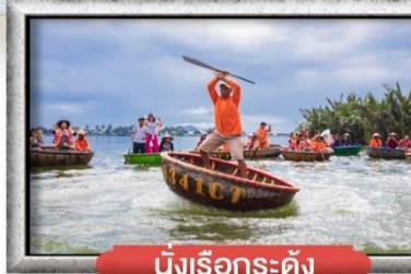
นั้งเรือกระดั่ง