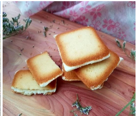
Photo: Global Excess Tokyo Suppliers ระบุผลิตภัณฑ์ทั้งหมด ชื่อโรงแรมที่ท่านพัก ทางบริษัทจะทำการแจ้งพร้อมใบนัดหมาย 3-5 วันก่อนเดินทาง

วันที่หก ทำอากาศยานนิวชิโตะเซะ-ทำอากาศยานสุวรรณภูมิ 📍 อาหาร เช้า