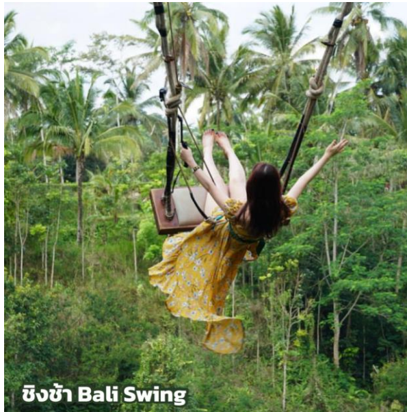
ชิงช้า Bali Swing

สัมผัสประสบการณ์สุดพิเศษกับชิงช้า BALI SWING (รวมค่าบริการแล้ว)