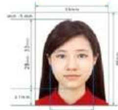
Paper Photo for Visa Application Form