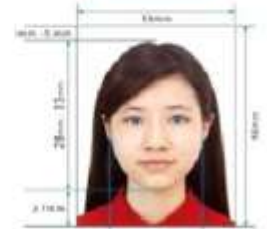
Paper Photo for Visa Application Form