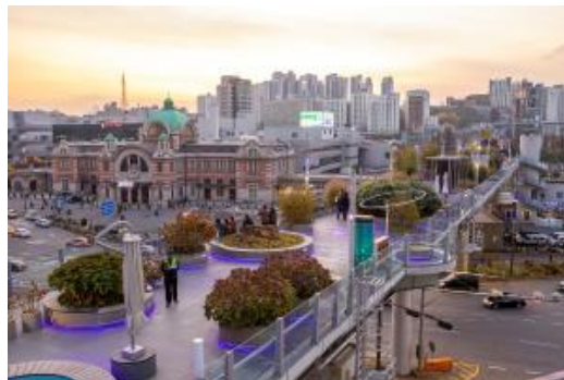
สวนลอยฟ้า Seoullo 7017