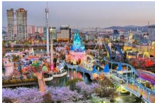
สวนสนุกล็อตเต้เวิลด์