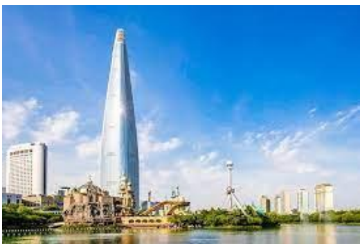
ล็อตเต้ โซล สกาย ทาวเวอร์