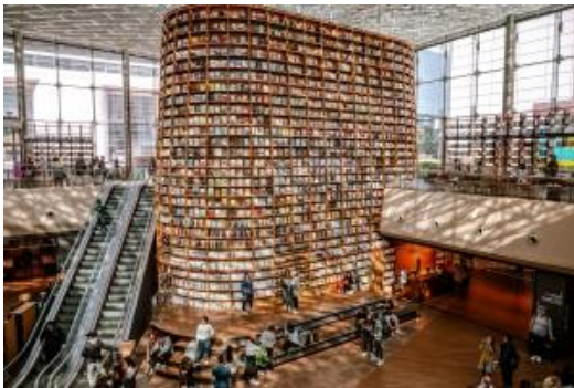
ห้องสมุด Starfield Library