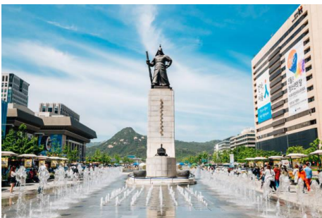
Gwanghwamun (จตุรัสควังฮวามุน)