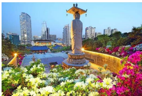
วัดพงอินซา